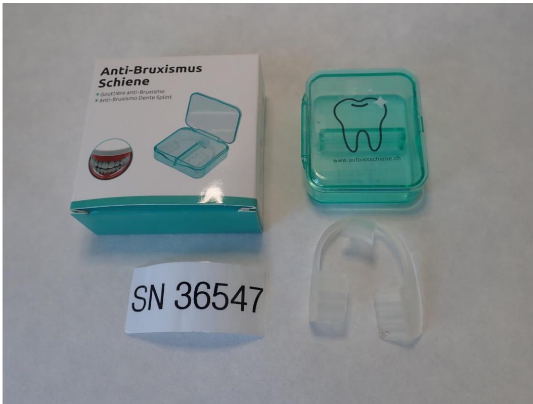
Figure A1: Aufbisschiene.ch